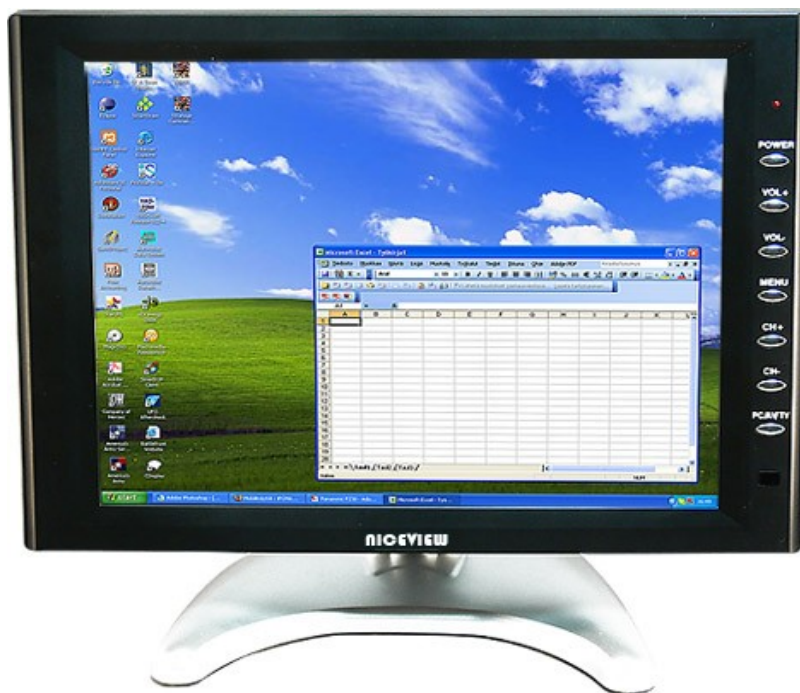
Kuva 1: Painikkeet näytön etupaneelissa.