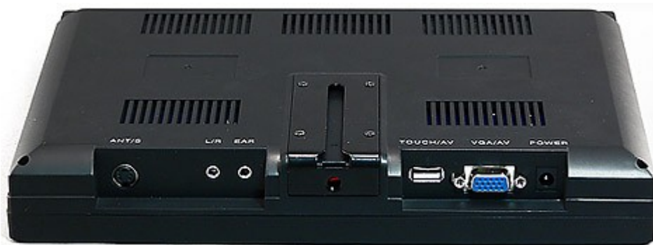
Kuva 2: Liittimet näytön takapaneelissa.